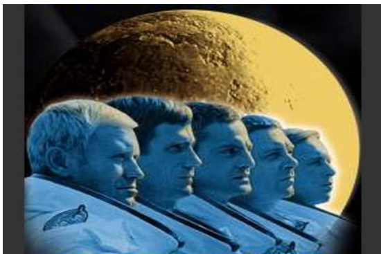
v. lks. Horst Frank, Jürgen Prochnow, ???, Uwe Friedrichsen, Klaus-Theo Gärtner

Menschenmassen drängeln sich auf dem Times Square. Blasmusik der heroischen Art hallt durch die Straßenschluchten, Konfetti regnet auf die Teilnehmer der Parade herab und die Welt schaut auf die erfolgreichen Rückkehrer der GANYMED-Mission – eines von drei Teams, das es geschafft hat. Das ist Ruhm, das ist die Unsterblichkeit.